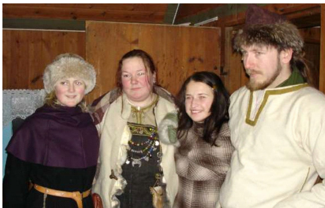
Hälsningar från Vikingaåret

Ett OÄNDLIGT tack till alla er som var med och medverkade till en mycket vacker invigning av Vikingaåret 2005!